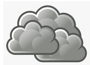
It's cloudy (nublado)