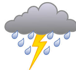
It's stormy (tormentoso)