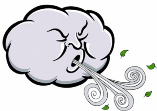
It's windy (ventoso - con viento)