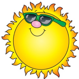
It's sunny (soleado)

(Sugerencia: revisar video https://www.youtube.com/watch?v=I8GeA3anPdo – How's the weather song).