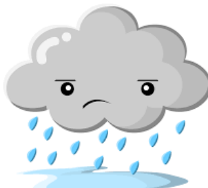
It's rainy (lluvioso)