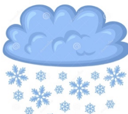
It's snowy (nevado)